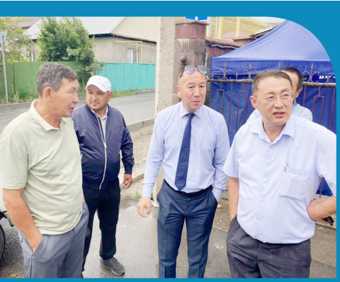
БҰҚАРА ҮНІ БИЛІК НАЗАРЫНДА 3-бет