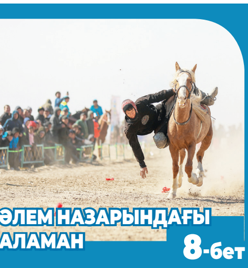
ӘЛЕМ НАЗАРЫНДАҒЫ АЛАМАН 8-бет

Қонаев қаласындағы орталық алаңда облыстық «Атамекен» кәсіпкерлер палатасы мен индустриалдық және инновациялық даму басқармасының бірлесіп ұйымдастыруымен «Бір ауыл – бір өнім» көрмесі өтті. Мақсаты – экономикамыздың негізгі күші саналатын агроөнеркәсіптік кешендегі бәсекеге қабілетті, сапалы әрі бірегей өнімдерді нарыққа шығару, шет елдерге экспорттау арқылы ауылдық аймақтардың дамуына үлес қосу.